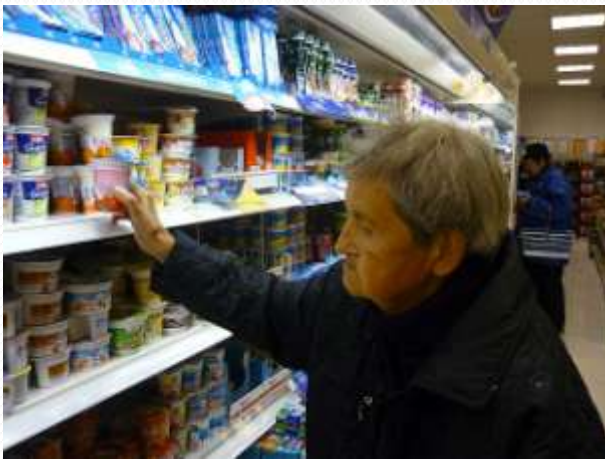
Při nákupu jogurtů v nákupním centru

1.10. jsme navštívili cukrárnu v nedalekých Vodňanech, které předcházela procházka městem spojená s drobnými nákupy. Klienti si mohli v nákupním centru sami vybrat zboží, které potřebují. Nakupovali jsme hlavně cukrovinky a jogurty.